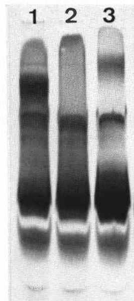
第1図 イネ白葉枯病菌LPSの電気泳動像